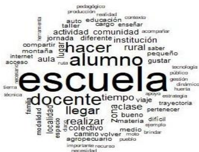
5.1. Análisis de similitud: RS “Trabajo docente en los márgenes”

La disposición gráfica de las coocurrencias entre las categorías emitidas en las narraciones presentes en las cartas, permitió advertir un árbol de similitud donde las categorías “escuela”, “alumno”, “docente”, “llegar”, “hacer”, ejes fundantes de la escena y dinámica pedagógica en situación de adversidad, se prefiguran como las que más conexiones establecieron con las restantes, presentándose por ello como centrales e irradiadoras de significado dentro de la estructura representacional contemplada. Igualmente, fue posible advertir que la primera categoría arriba señalada, “escuela” , se mostró estrechamente relacionada con otras de relevancia, pero de corte más contextual, tal es el caso de: “zona”, “comunidad”, “localidad”, “contexto”, “lugar”, “rural”, “montaña”, “difícil”, “actividad”, “educación”, “técnica”, “diferente”, entre otros. De la misma manera, la segunda categoría, “alumno” , se presentó más asociada a: “jornada”, “herramienta”, “taller”, “huerta”, “realizar”, “enseñar”, “saber”,